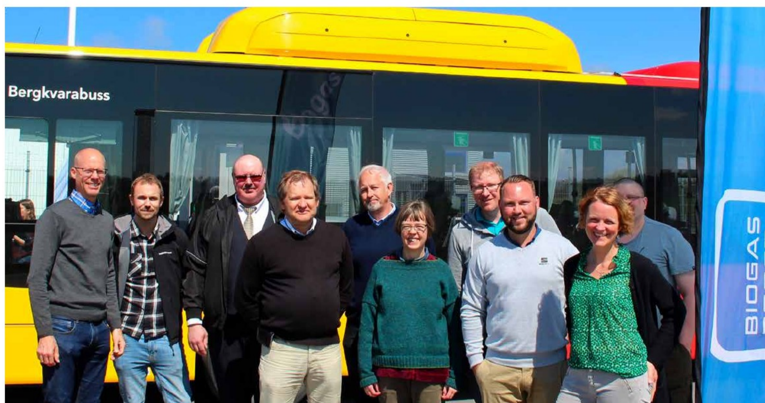
Representanter från projektet Biogasboost, Mörbylånga och Borgholms kommun, Bergkvarabuss, Miljöfordon Sverige och JL-bilar var i Mörbylånga för att sprida information om biogas.