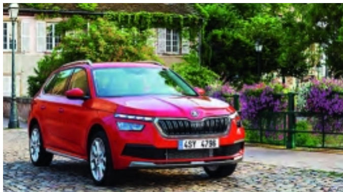
Nya Skoda Kamiq med gasdrift.