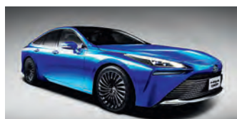
Nya Toyota Mirai.

Nya Toyota Mirai är inte helt lanserad, men klart är att räckvidden på den nya versionen av den vätgasdrivna bränsle-cellsbilen är över 60 mil. Övrig data offentliggörs senare i år i samband med att bilen börjar säljas.