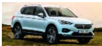
Seat Tarraco byggs om för gas.

Priser och annan info om dessa modeller är inte klara ännu, men kommer under våren.