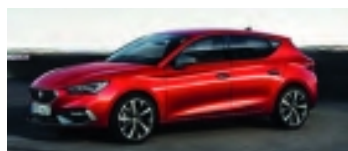
Seat Leons nya design.